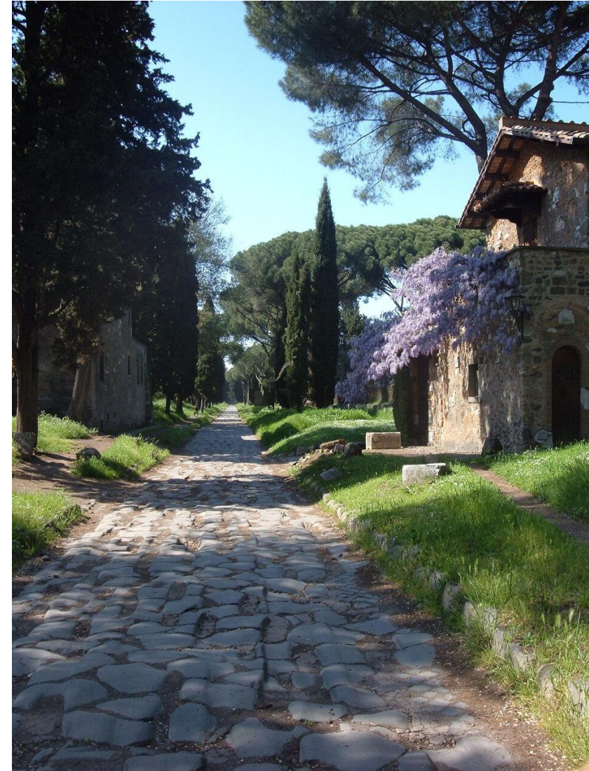
Via Appia, Rome

Décollage du vol ROME/BORDEAUX , sur une compagnie régulière ou low-cost et en classe économique.